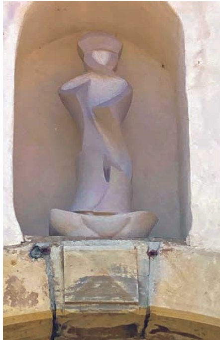
Nouvelle statue de saint Nicolas.

Mon envie première était de proposer une sculpture aux frontières de l'abstraction. En effet, il me paraissait plus pertinent, d'une part, d'exprimer une forme de "généralité" plutôt que des traits physiques hypothétiques et, d'autre part, de mettre en avant des éléments du monde marin : l'Océan et le Vent, moteur