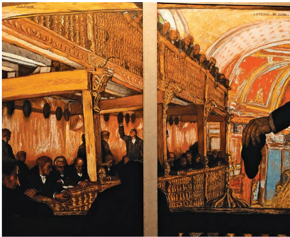
Pablo Tillac, « Messe à Cambo, l'étage des hommes », pastel sur deux feuilles encadrées ensemble (50 x 32 cm chaque feuille). Signé et situé. Collection particulière.

Au XX e siècle, c'est l'artiste Pablo Tillac (1880-1969), né Jean-Paul Tillac à Angoulême et installé à Cambo en 1919, qui illustre le mieux l'expression rituelle de la religion des Basques. Ce n'est pas tant la profondeur de l'âme que la pratique religieuse, sous ses multiples formes, qui apparaît sous son crayon. Plus que tout autre artiste de sa génération, délaissant la