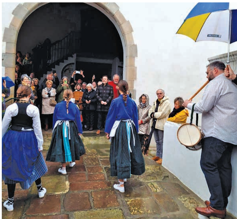
Inauguration de la statue de saint Nicolas.