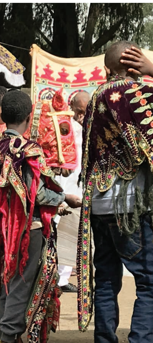
Fête des Rameaux en Éthiopie.