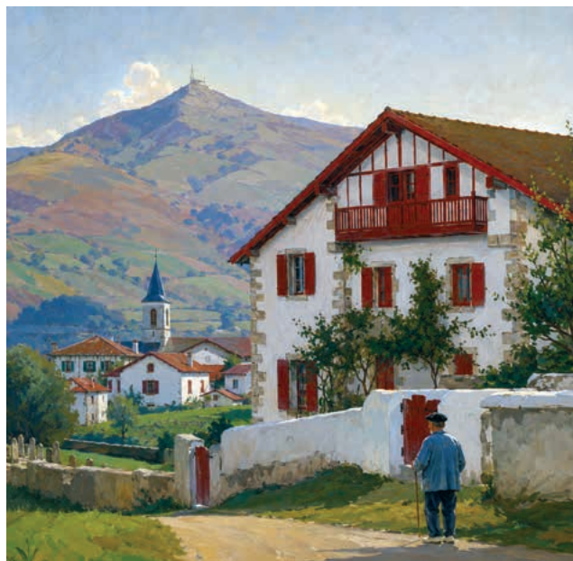
Création originale pour Denak Argian – Tous dans la Lumière